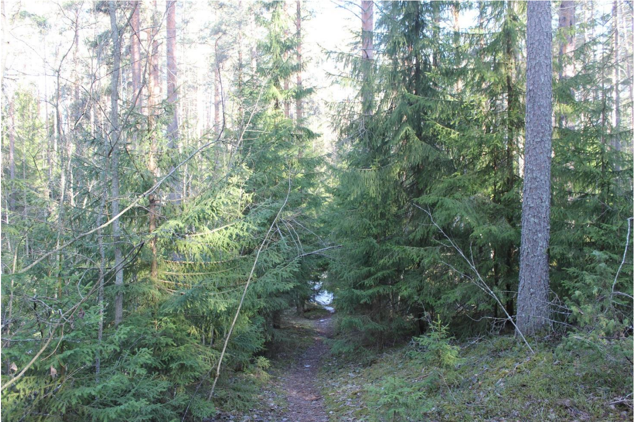
Kuva 1. Alikasvoskuuset vähentävät valon määrää kenttäkerroksessa.